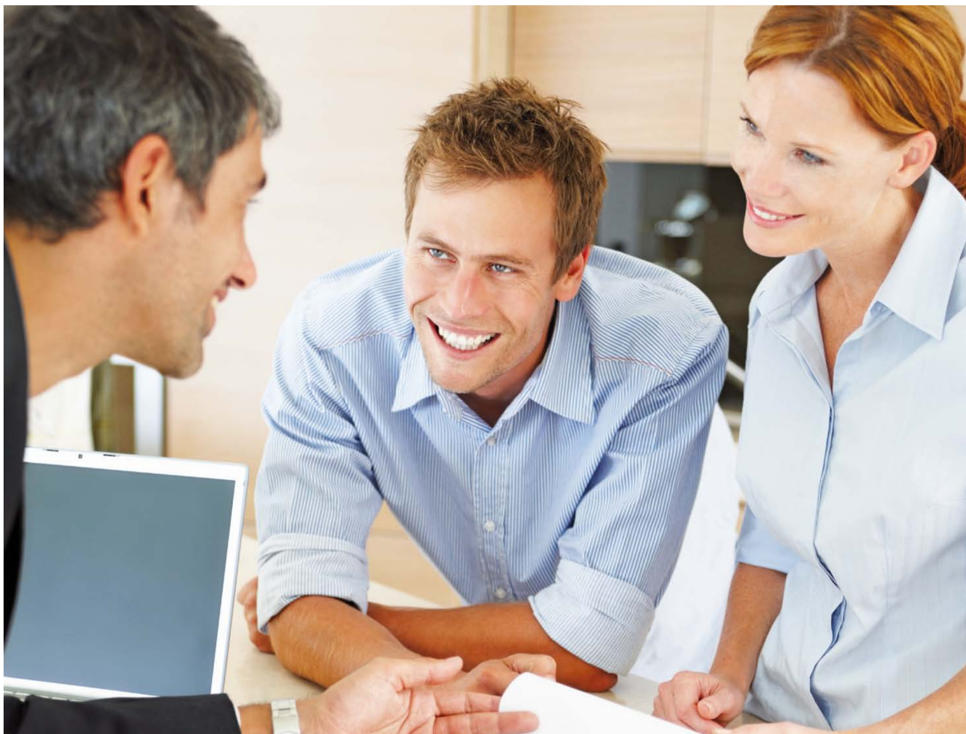
Ein freundlicher Empfang, das Gespräch in angenehmer Atmosphäre, die Nähe zum Kunden – das sind beste Voraussetzungen für gute Beratung.

VOLKSBANK HEILBRONN. DIE GENOSSENSCHAFT, DIE NÄHE SCHAFFT.