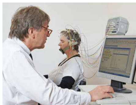
KiNuP steht für bessere Gesundheit.

„Eigeninitiative und Eigenverantwortung stehen heute hoch im Kurs“,