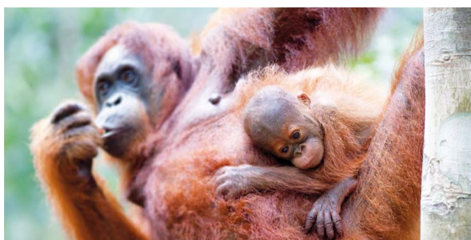
Nähe ist überlebenswichtig. Auch für soziale Gesellschaften.

Auch wird Technologie ohne die Balance aus Funktionalität und gelebter Nähe befremdlich: 70 % finden Bedienungsanleitungen unverständlich.* Kaum jemand versteht die Kürzel moderner Techniksysteme. Wir sehen uns einer Funktionsvielfalt bei Geräten gegenüber, die wir nur zum kleinen Teil nutzen. Die Schuld der Technik ist es nicht, wenn wir im Umgang mit ihr einsam zurückbleiben. Nur ist einfach kein realer Mensch in der Nähe, der erklärt und Fragen direkt beantwortet.