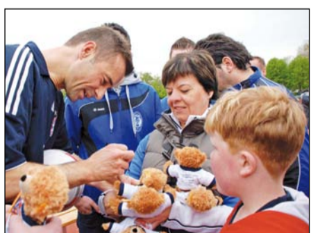
Kai Pflaume unterschreibt Melchior, die nun versteigert werden.