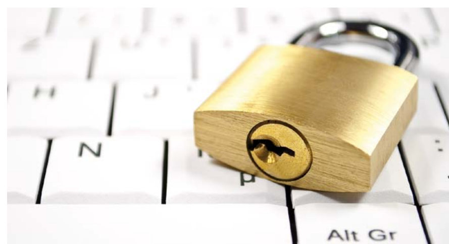
Online-Banking – bei der Volksbank Heilbronn eine sichere Sache.

Das Smart-TAN-plus-Verfahren ist der nächste Schritt hin zu mehr Sicherheit, das Anfang 2011 kommt. Mit einem Smart-TAN-Leser und der persönlichen Bankkarte wird dabei eine individuelle TAN generiert und mit dem Auftrag verknüpft. So werden Transaktionen doppelt sicher. Rein technisch gesehen, funktionieren viele Beziehungen also auch auf Distanz. Doch sind wir Menschen und keine funktionierenden Objekte. Darum ist die Gemeinschaft der Volksbank Heilbronn immer ganz in der Nähe. Mit einem persönlichen Ansprechpartner und Zeit. V jr