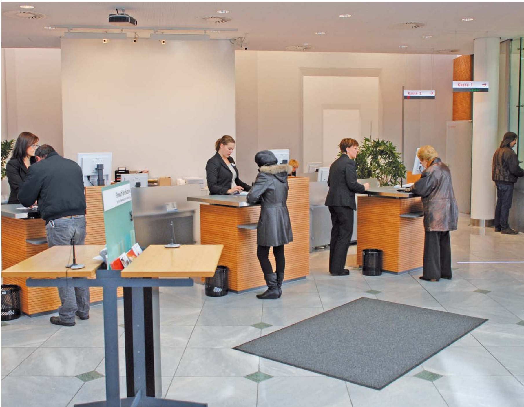
Schön, dass man auch im Internet-Zeitalter die Nähe pflegen kann: bei der Volksbank Heilbronn an genau 35 Standorten in Stadt und Region.

VOLKSBANK HEILBRONN. DIE GENOSSENSCHAFT, DIE NÄHE SCHAFFT.