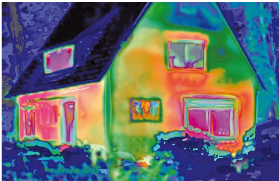
Die Wärmebildaufnahme bringt an den Tag, wo wertvolle Energie in Haus und Wohnung verlorengeht.

Je heller der Farbton auf der Aufnahme, desto höher die Wärmeabstrahlung und damit der Wärmeverlust. Eine Analyse zeigt, welche Sanierungsmaßnahmen sinnvoll sind. Die Volksbank vermittelt auf Wunsch Kontakt zu einem Meister-Fachbetrieb aus der Region, der berechtigt ist, Energieausweise auszustellen. Volksbank und örtliches Handwerk waren schon immer starke Partner. Ob Immobilienkauf, Immobilienverkauf, Renovierung und Modernisierung, Finanzierung oder Energiesparmaßnahmen – Informationen gibt es in allen Filialen. Dort kann man auch das Wärmebild in Auftrag geben. V schw