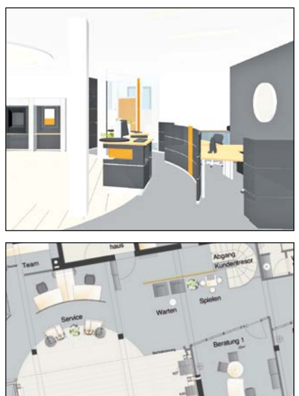
Großzügige Gestaltung, kundenfreundliche Servicebereiche, Beratung in angenehmer Atmosphäre – das wird die neue Volksbank in Untereisesheim.

Untereisesheim: Bis Ende Januar 2011 wird die Filiale für circa 750.000 Euro komplett renoviert. Bereits Mitte Dezember ist der erste Bauabschnitt fertig. Dann öffnet die neue Schalterhalle mit erweitertem SB-Automatenangebot auch für Rollstuhlfahrer. Großzügiger präsentieren sich die Beratungsräume Mitgliedern und Kunden. Im zweiten Bauabschnitt werden die derzeit provisorisch genutzten Bankräume neu gestaltet.