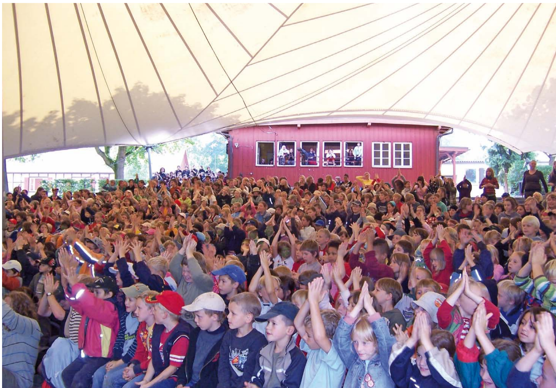
Der Hit vom „Berg“: „Lustig ist's Vakanzenleben, Gaffenberg, Gaffenberg, hoch!“

VOLKSBANK HEILBRONN. DIE GENOSSENSCHAFT, DIE NÄHE SCHAFFT.