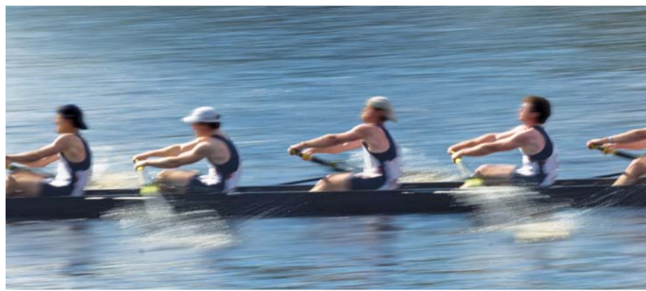
Wenn alle das Ziel kennen, gilt nur noch die Schlagzahl, nicht die Hierarchie.