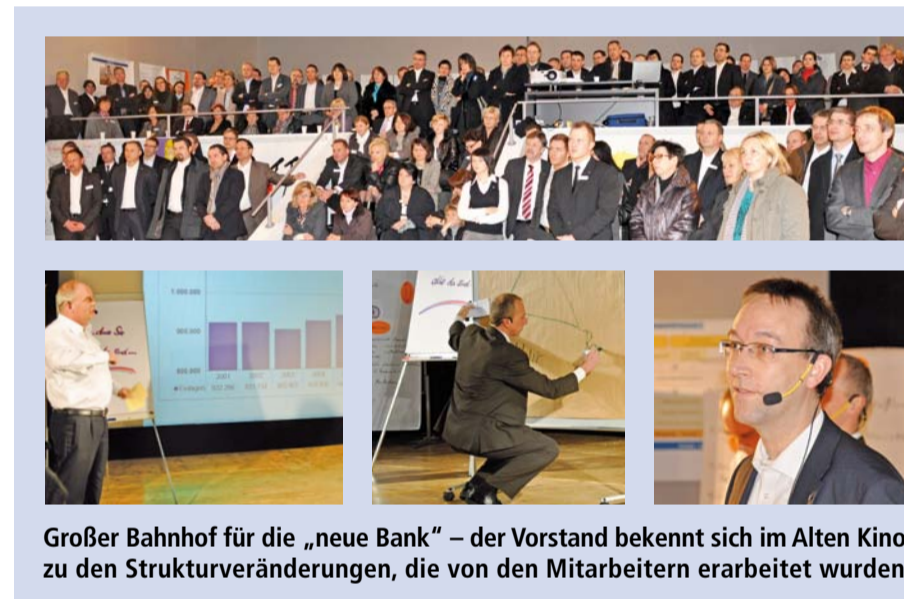
Großer Bahnhof für die „neue Bank“ – der Vorstand bekennt sich im Alten Kino zu den Strukturveränderungen, die von den Mitarbeitern erarbeitet wurden.

Im Mai des letzten Jahres startete folgerichtig die gesamte Bank eine umfang-