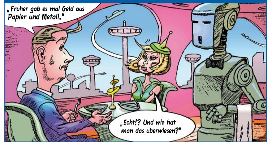
„Früher gab es mal Geld aus Papier und Metall.“